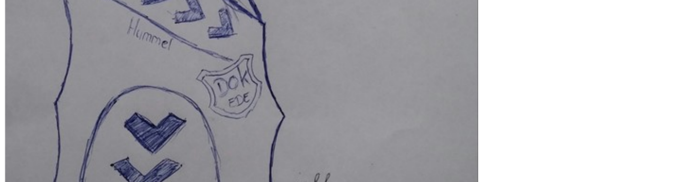
Arnout maakte bovenstaande én onderstaande tekening